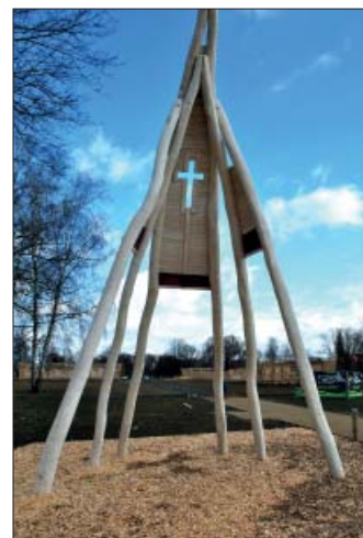
Cyrkej dožiwiš na BUGA na wšelakore wašnje.