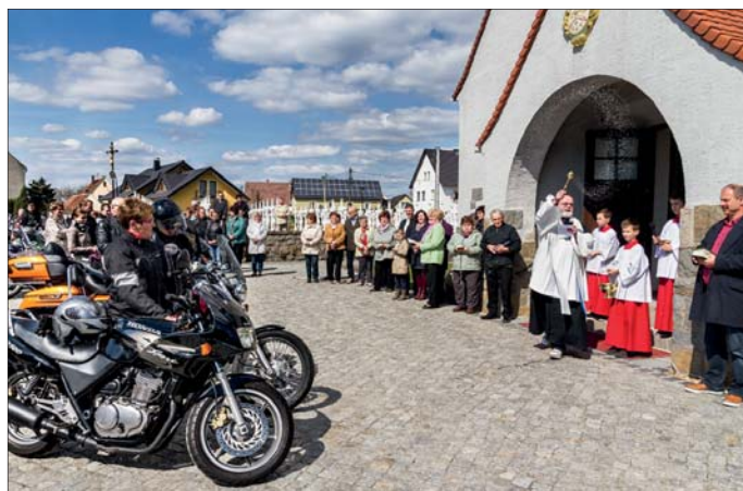
Farar Nawka požohnowa w přitomnosći mnohich wěriwych bikerow a jich jězdźidla. Wjace: www.posol.de

Mjeztym 12. nyšpor za bikerow a požohnowanje motorskich w Ralbicach