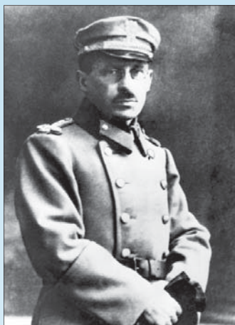
Nan Karol Wojtyła

Tola kardinal Sapieha njebě so mylił. Měješe jenož štyri lěta čakać, doniž so nadžijepoły abiturient sam njeprizjewi. Zwjet-