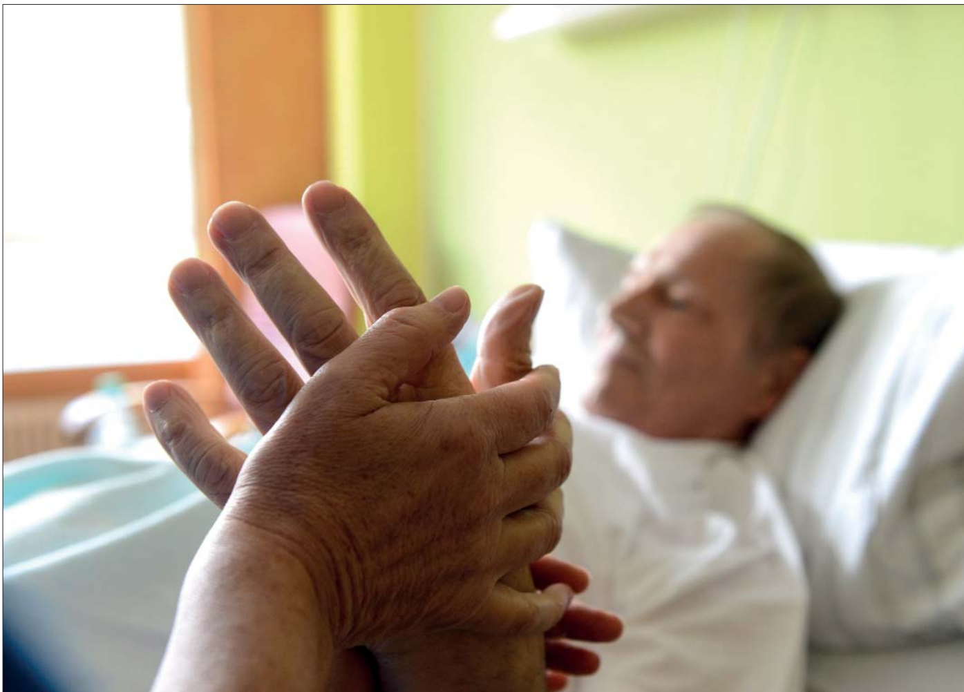
Na smjerc choremu čłowjesku bliskosc wopokazać je kmna forma přewodženja na jeho poslednim puću.