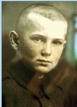
Młody Karol Wojtyła

so jimaj po synu Edmundže we wotstawku 14 lět hišće 18. meje 1920 syn Karol narodzi. Jenička dzowčička bě hnydom po poro-