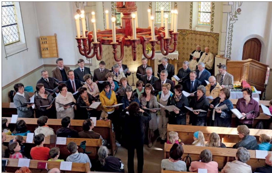
Chróšćanski cyrkwinski chór wobrubu Božu službu w Smječkečanskej cyrkwi.

Farar Clemens Hrjehor předo- waše k ewangelijej wo wustrow- wjenju wiciwiho. Cyrkwinskej chóraj z Chróšćic a Halštrowa-Smječekc wobrubištej z rjanymi hudźbnymi kruchami ekumenisku nutrnosć. W serbskich a něm-