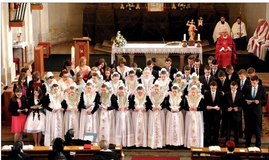
Firmowani zanjesechu na Božej mši nazwučowany spěw.

bě „so modlić“. Modlo so zdźeržimy počah k Bohu, štož naše žiwjenje jako křesćenjo wučinja. Třeći dydk bě „so nastajić“. Přeco zaso mamy so na puć podać a za tym pytać, k čemuž smy powoľani.