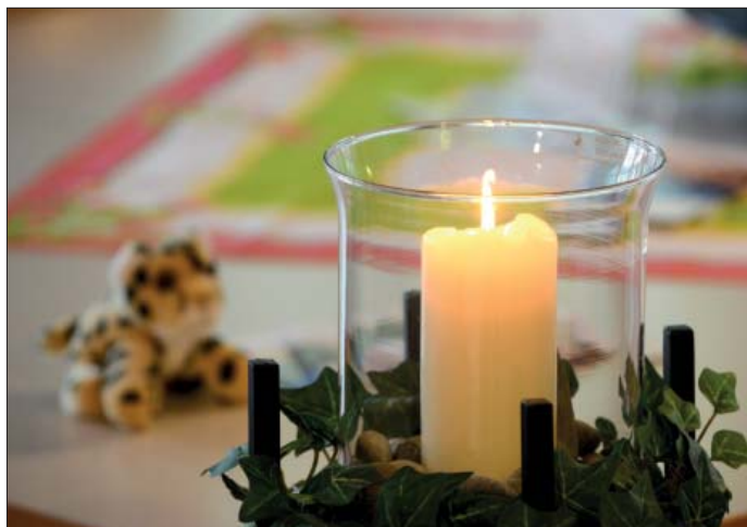
Swěčka swěći so na paliatiwnej staciji. Tam zwjazuju medicinsku terapiju a psychologiske zastaranje mrějacych.

zmysłaťočne a što jenož čerpje nje podlěši. Hladajo na zakonske postajenje w susodnych krajach Němskeje kaž w Belgiskej a w Nižozemskej, hdžež je dowolene, zo smě lěkar aktiwnje pomhać žiwjenje skónčić, je po zašłym w nowembru wozewjenym naprašowanju Deutschlandtrend tež pola nas hižo 46 procentow woprašanych samneho měnjenja. Kak skoku pak potom nastawa čišć na starych a čežko chorych, tola „so zminyć“, zo njebychu swójbnych